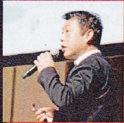
起業機運を高める

起業家同士の情報交換や人的ネットワーク形成を支援することで、起業機運を醸成し、地域内で継続的に起業家を応援・支援するしくみをつくり、地域活性化へとつなげます。