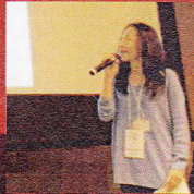
地域の起業家を知ってもらう

“起業”をテーマに先輩起業家でもある市原市長と市原で起業を実現した5人のプレゼンターによるパネルディスカッションを行います。